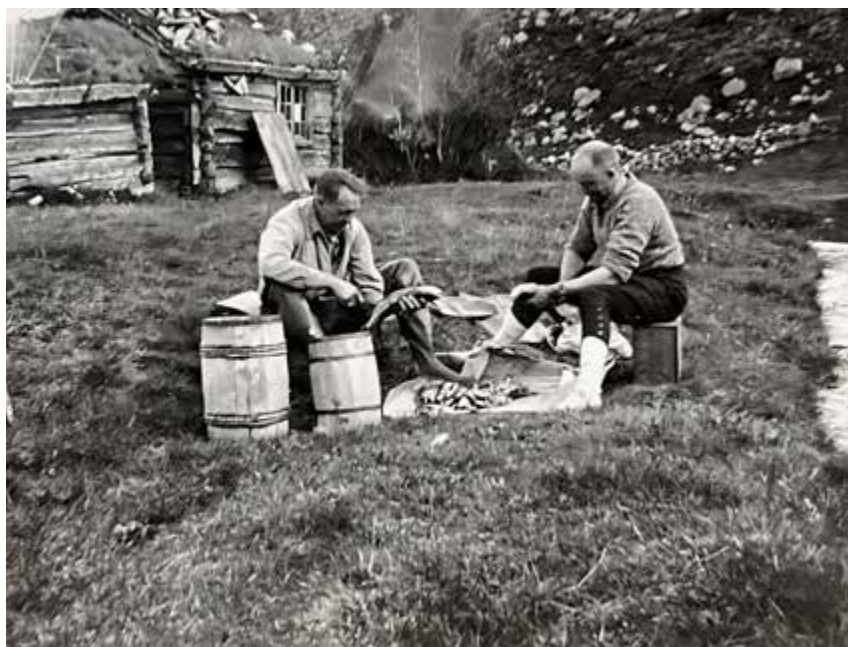
Fiskere på Grøtådalsetra.