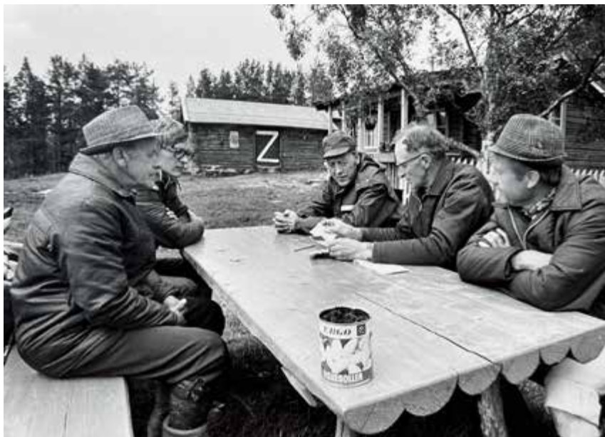
Daværende statsminister Odvar Nordli besøkte Haugen på syttitallet.