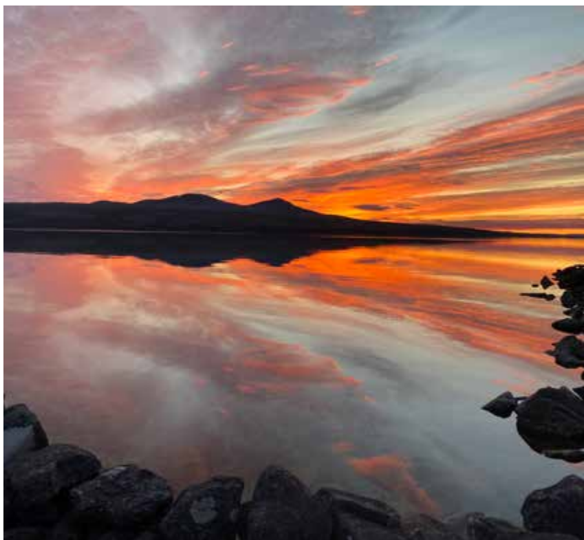
Solnedgang over Flenskampan (1292 moh.) sett fra Haugen.