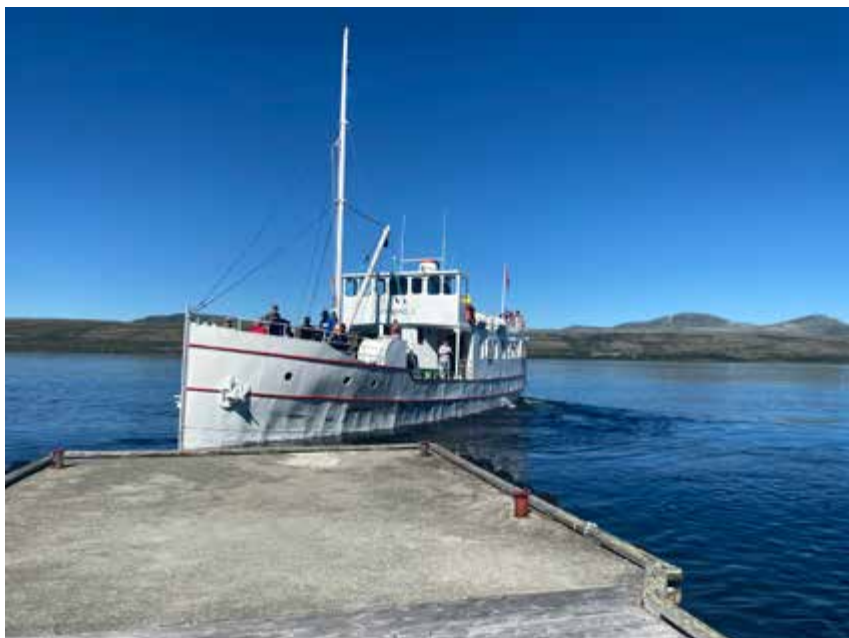
Fæmund II legger til brygga på Haugen.