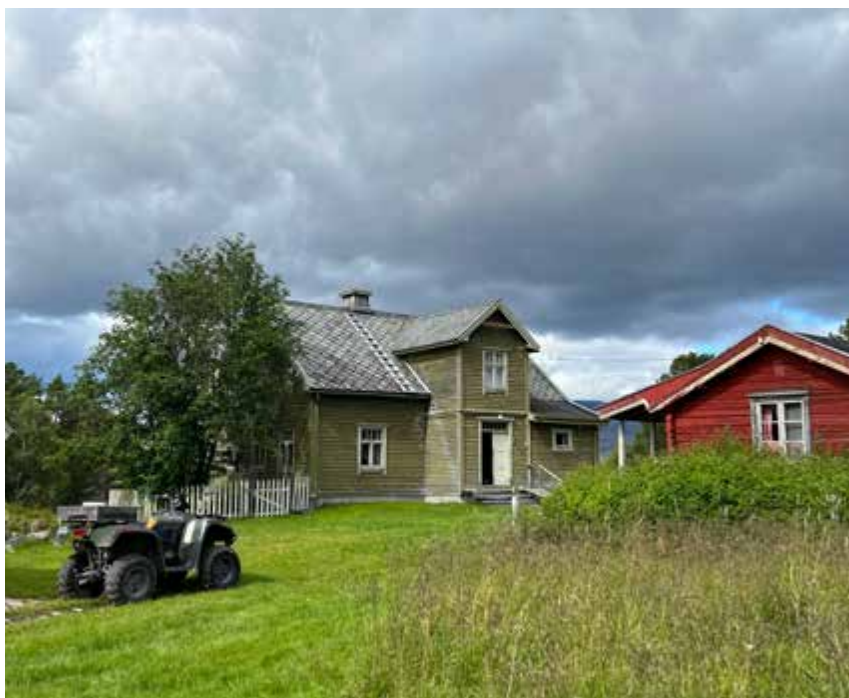
Hovedhuset på Haugen, Vinterstuggu, ble bygd i 1938.