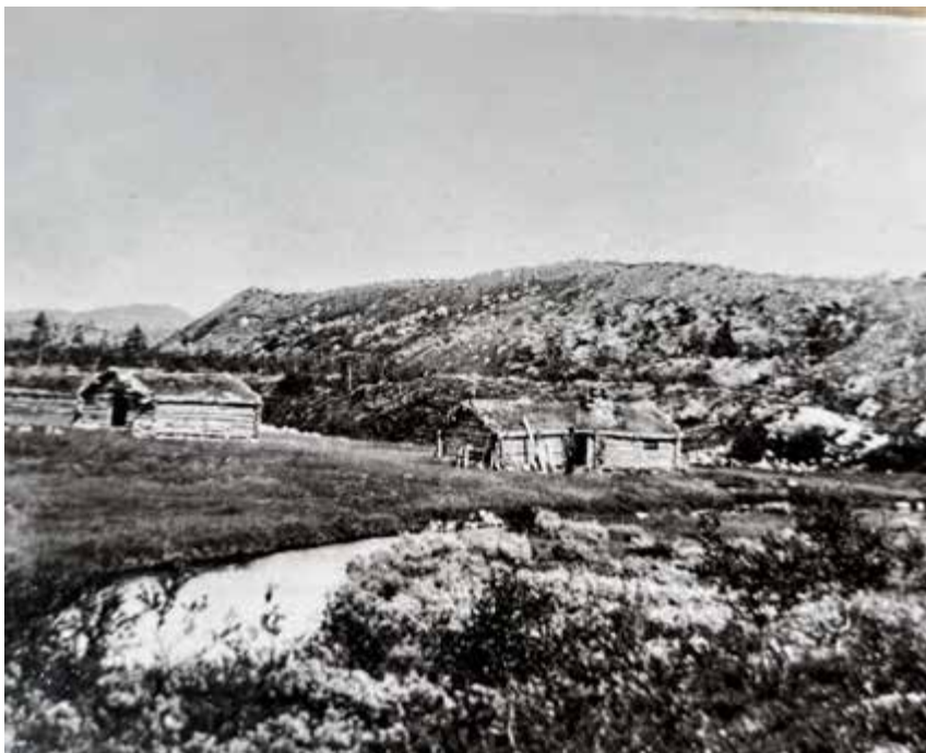
Ingen vet hvor gammel Grøtådalsetra er, men trolig har den vært seter for Femundshytten allerede på 1700-tallet.