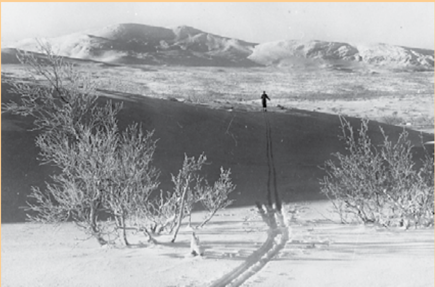
På skitur mellom Sylen og Svukuriset. Fjellet i bakgrunnen er Elgåhogna (1460 moh.).

Mangt et bymenneske som har steget i land har nok gjort seg noen tanker om hvordan tilværelsen må arte seg for dem som lever livene sine her inne året rundt. For i uker og måneder når isen fryser til om høsten, og når den tiner om våren, er folket i Sylen overlatt til seg selv.