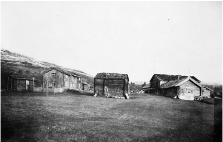
Gammelgården i Sylen.

Håpet om fortsatt fast bosetning i den lille grenda, knytter seg til et par modige svensker som vil gi nytt liv på Sylseth.