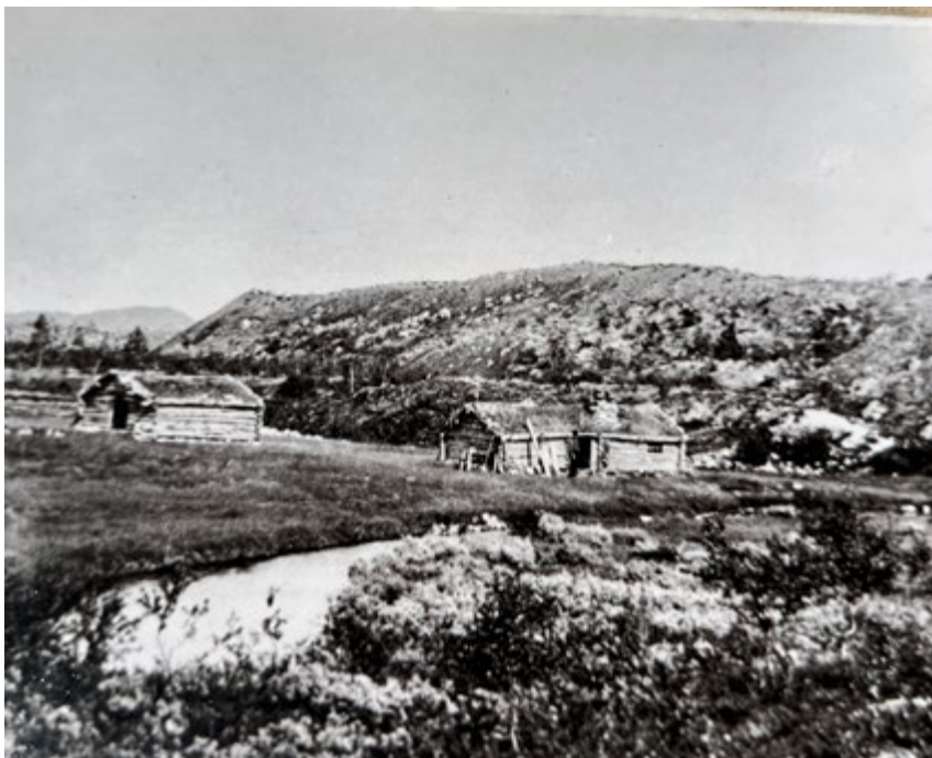
Ingen vet hvor gammel Grøtådalsetra er, men trolig har den vært seter for Femundshytten allerede på 1700-tallet.