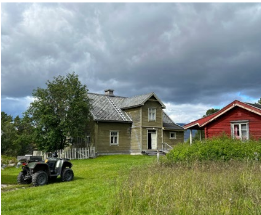
Hovedhuset på Haugen, Vinterstuggu, ble bygd i 1938.