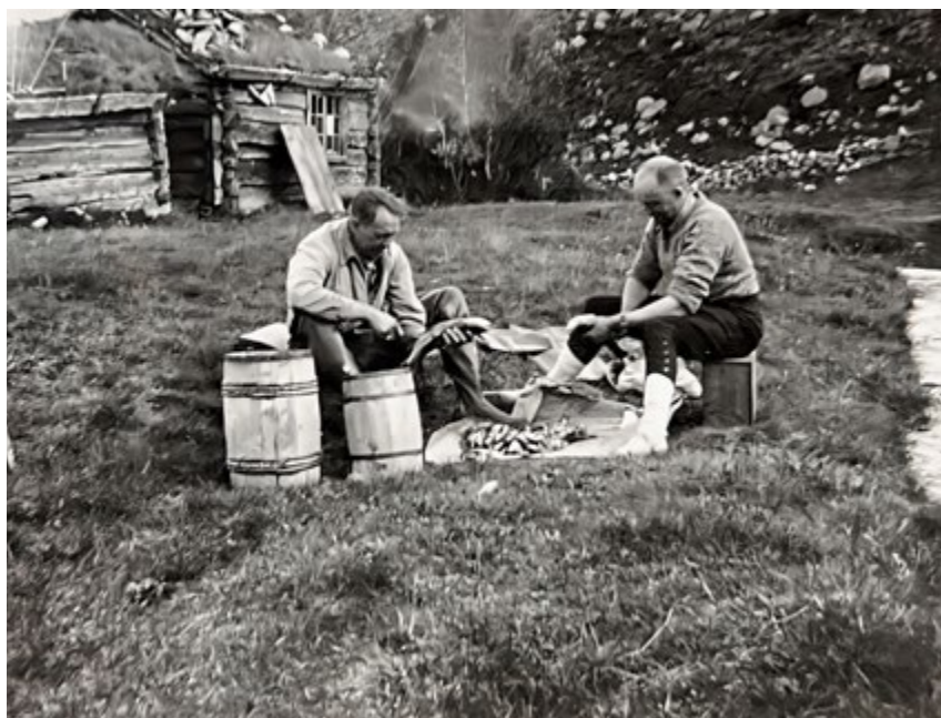
Fiskere på Grøtådalsetra.