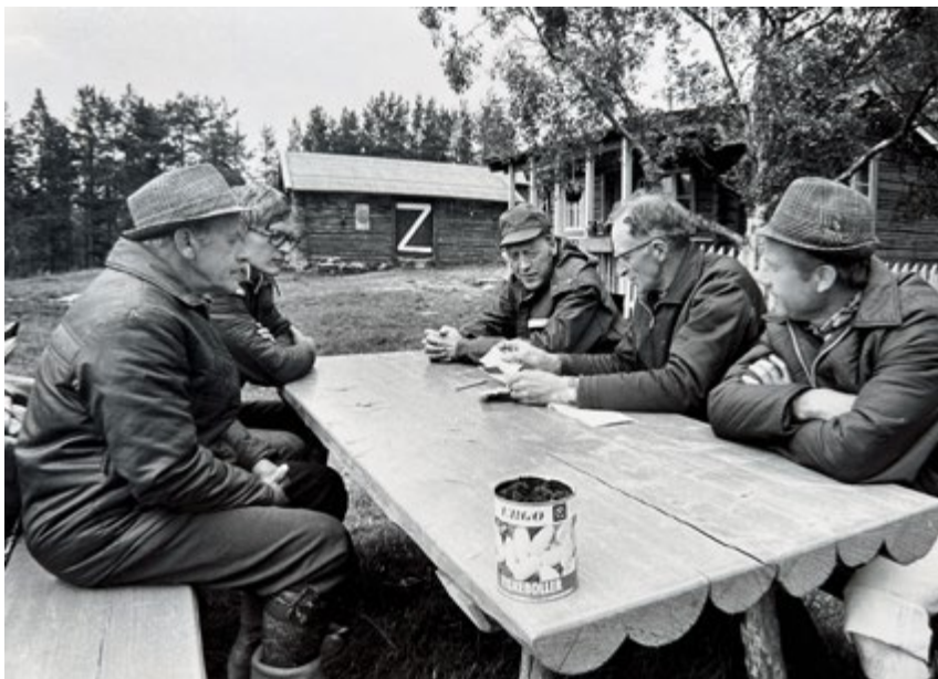
Daværende statsminister Odvar Nordli besøkte Haugen på syttitallet.